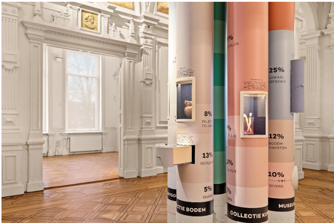
Villa Curiosa: de speelse, permanente stadstentoonstelling

Villa Curiosa maakt deel uit van het meerjarenplan Jan Cunen is van OnSS (2021-2024), ondersteund door onder andere Mondriaan Fonds, VSBfonds, het VriendenLoterij Fonds, Fonds Jan Cunen en Gemeente Oss.