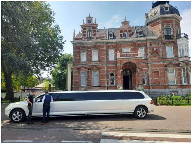
Trouwen in Museum Jan Cunen

Het aantal grote externe evenementen (>25 personen) daalde van 21 in 2024 naar 17 in 2025. Daartegenover stond een duidelijke stijging van het aantal kleinere evenementen (<25 personen): van 21 in 2024 naar 46 in 2025. Deze groei is mede te verklaren door het overnemen van 22 huwelijksceremonies van de gemeente Oss. Vanwege een interne verbouwing van de gemeentelijke trouwzaal werd tijdelijk uitgeweken naar een alternatieve locatie. In goed overleg is besloten deze huwelijken bij Museum Jan Cunen te organiseren. Deze samenwerking werd positief ontvangen en leidde tot grote tevredenheid bij de betrokken echtparen.