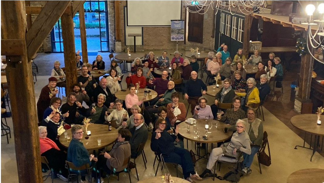
Gezamenlijk uitje naar Het Nederlands Openluchtmuseum in Arnhem

Naast het werk was er ook aandacht voor ontmoeting en onderlinge verbondenheid. Vrijwilligers en teamleden namen deel aan gezamenlijke activiteiten, waaronder het jaarlijkse teamuitje naar het Nederlands Openluchtmuseum in Arnhem, de feestelijke openingen van tentoonstellingen en een goedbezochte kerstbijeenkomst.