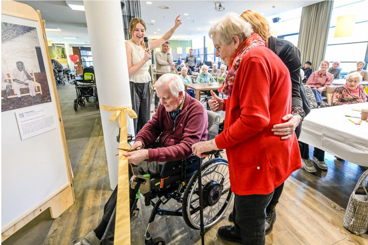
Opening Geef me je hand en vitrine Casa Curiosa in verpleeghuis Katwijk

Dankzij subsidie van het Lang leve Fonds hebben we, na de start in 2024, de samenwerking met Club Goud en verpleeghuis Katwijk kunnen verzilveren in de tijdelijke tentoonstelling ' Geef me je hand ', met bijbehorend randprogramma voor bewoners en een permanente presentatie van Casa Curiosa . Op deze manier brengen we kunst en erfgoed dichtbij mensen, ook als zij het museum zelf minder gemakkelijk kunnen bezoeken.