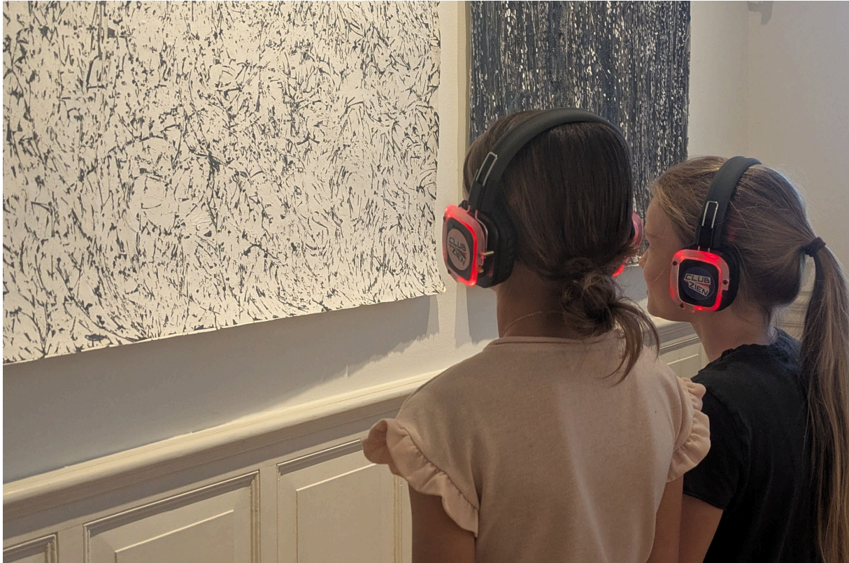
OKVO basismenu Kunst met al je zintuigen : kunst gecombineerd met muziek!

Vanuit het OKVO Plusmenu worden meerdere programma's aangeboden aan de andere groepen van het basisonderwijs. Ook enkele basisscholen buiten OKVO weten ons dit jaar te vinden. Het programma Overgisteren – waarbij kleuters spelenderwijs het museum ontdekken – is vernieuwd in samenwerking met Erfgoed Brabant. Scholen zijn hiervan op de hoogte gesteld met een flyer per post; dit heeft enkele nieuwe aanvragen opgeleverd.