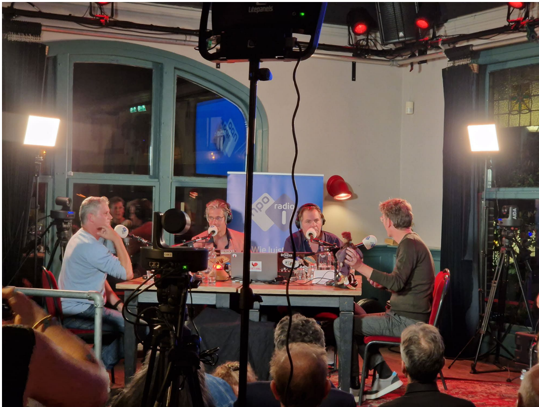
Pop-up radiostudio waarbij de conservator en directeur van museum Jan Cunen geïnterviewd worden