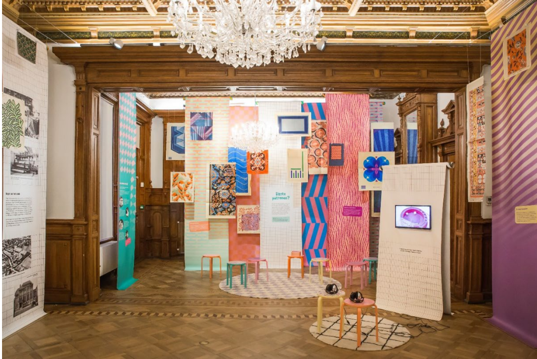
Volgens Vaste Patronen waar hedendaagse kunstenaars zich laten inspireren door 10.000 patroontekeningen

Wie Oss zegt, zegt margarine, worst en medicijnen. Iets minder bekend is de rijke textielgeschiedenis van de stad. Een historie die begint bij het Osse Bergoss (1856-1982): een kleine wattenfabriek, die zich ontwikkelt tot een landelijk toonaangevend bedrijf, met name in tapijten.