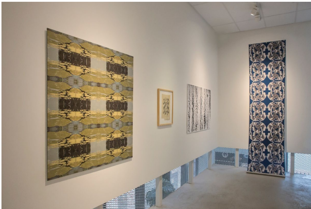
De Gastenkamer met werken van zes leden van het lokale kunstcollectief K26